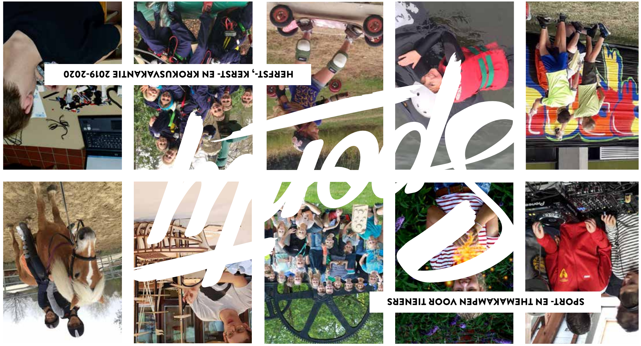
HERFST-, KERST- EN KROKUSVAKANTIE 2019-2020